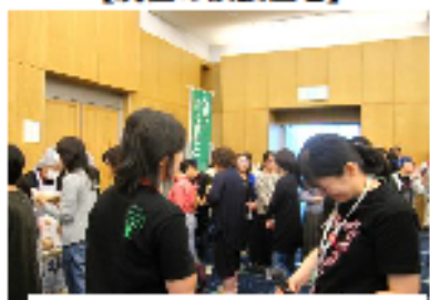
【グランメッセで4月29日から約4ヵ月間行った炊き出しを再現】

グリーンコープ生協（長崎） 組合員数：15,812人 (2017年6月20日現在) ～緑の地球をみどりのままで～