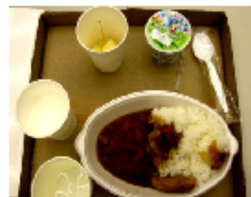
【震災当時、提供された炊き出しメニュー】

グリーンコープくまもとのみなさんは自らが震災の当事者でありながら、直後より懸命に配送商品を届け、炊き出しや片付けなどの支援を行ってこられました。また、福祉施設の避難所としての開放や生活再生支援など幅広い活動をされていました。食べ物はもちろん、福祉や生活再生事業など多方面に取り組むグリーンコープだからこそ、グリーンコープくまもとを中心にオールグリーンコープで支える体制が作られています。