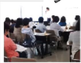
▲スライドやDVDでせっけんと合成洗剤のちがいを、せっけんの使い方を教えていただきました。