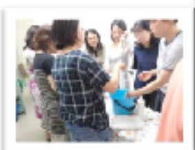
▲理事によるブースでは食器用せっけんとハミガキ粉をアピール。