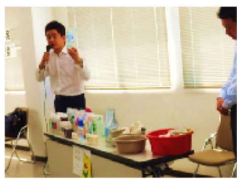
▲茶しぶや洋服のしみも炭酸ソーダや漂白剤と合わせて真っ白に!