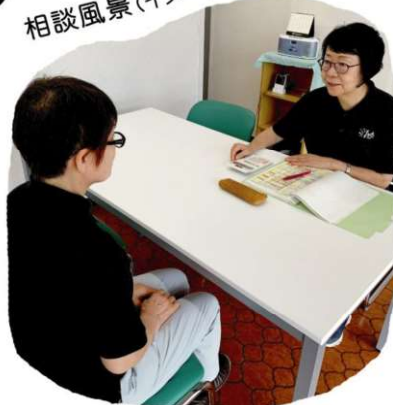
相談風景(イメージです)

それぞれの状況に合わせた家計の見直しプランを つくり、解決へ向けてサポートします。